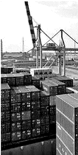
Container nel porto di Venezia